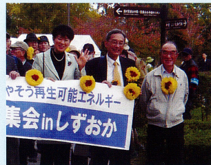
原発集会で本村衆議院議員、島津前衆議院議員